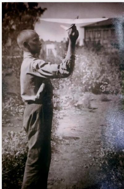
Ученик 7 класса 11 средней школы, участник соревнований юных авиамodelистов, 1939 г.