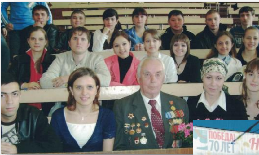
Встреча со студентами