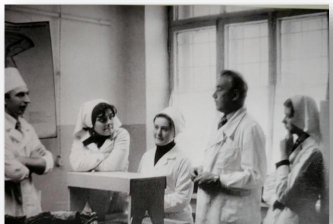
Практическое занятие на каф. оперативной хирургии

С 1964 г. по 1988 г. возглавлял кафедру оперативной хирургии и 24 года был ее бессменным руководителем.