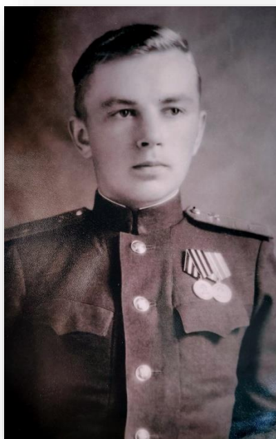
Зам. командира 1-й батареи 1-го дивизиона 524 десантно- артиллерийского полка. Ленинградский фронт, г. Шлиссербург, август 1944 г.

Добровольно пошел в воздушно – десантную бригаду. Будучи командиром взвода парашютистов – десантников (в 19 лет!) участвовал в освобождении Киева. В январе 1944 г. был переброшен на Ленинградский фронт, где являлся командиром огневого взвода зенитной батареи. Там участвовал в снятии блокады Ленинграда.